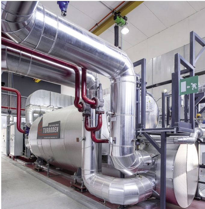
Figura 4 | Un modulo ORC lavora automaticamente, può essere gestito e mantenuto facilmente e ciò implica una richiesta limitata di specializzazione del personale, nonché bassi costi di manutenzione ed esercizio.

Altro caso di utilizzo del vapore si ha nei caseifici, ad esempio per la produzione di latte a lunga conservazione. In questo caso, la tecnologia ORC può adattarsi in modo adeguato al fabbisogno energetico generando circa 700 kW di energia elettrica e una portata di 5 ton/ora di vapore alla pressione di 15 bar necessari per pastorizzare il latte a lunga conservazione.