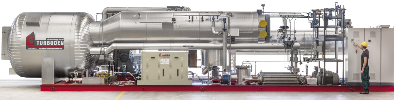
Figura 2 | Modulo ORC, Organic Rankine Cycle, nel quale il fluido organico evapora e aziona una turbina accoppiata ad un alternatore per la produzione di energia elettrica. I moduli ORC hanno lasciato da tempo lo stadio di prototipo e si contano svariate applicazioni. ( Turboden )

L'impianto di produzione di energia elettrica (tecnologia ORC) è stato progettato appositamente per soddisfare le condizioni del processo di funzionamento specifici del caso. Per aumentare il rendimento del processo di produzione di elettricità, la caldaia a olio diatermico viene integrata da due economizzatori in grado di abbassare la temperatura dei gas combusti in uscita dalla caldaia ad olio diatermico, e di conseguenza di aumentare il grado di efficienza elettrica dell'impianto nel suo insieme (in termini di quoziente tra output elettrico e input di biomassa).