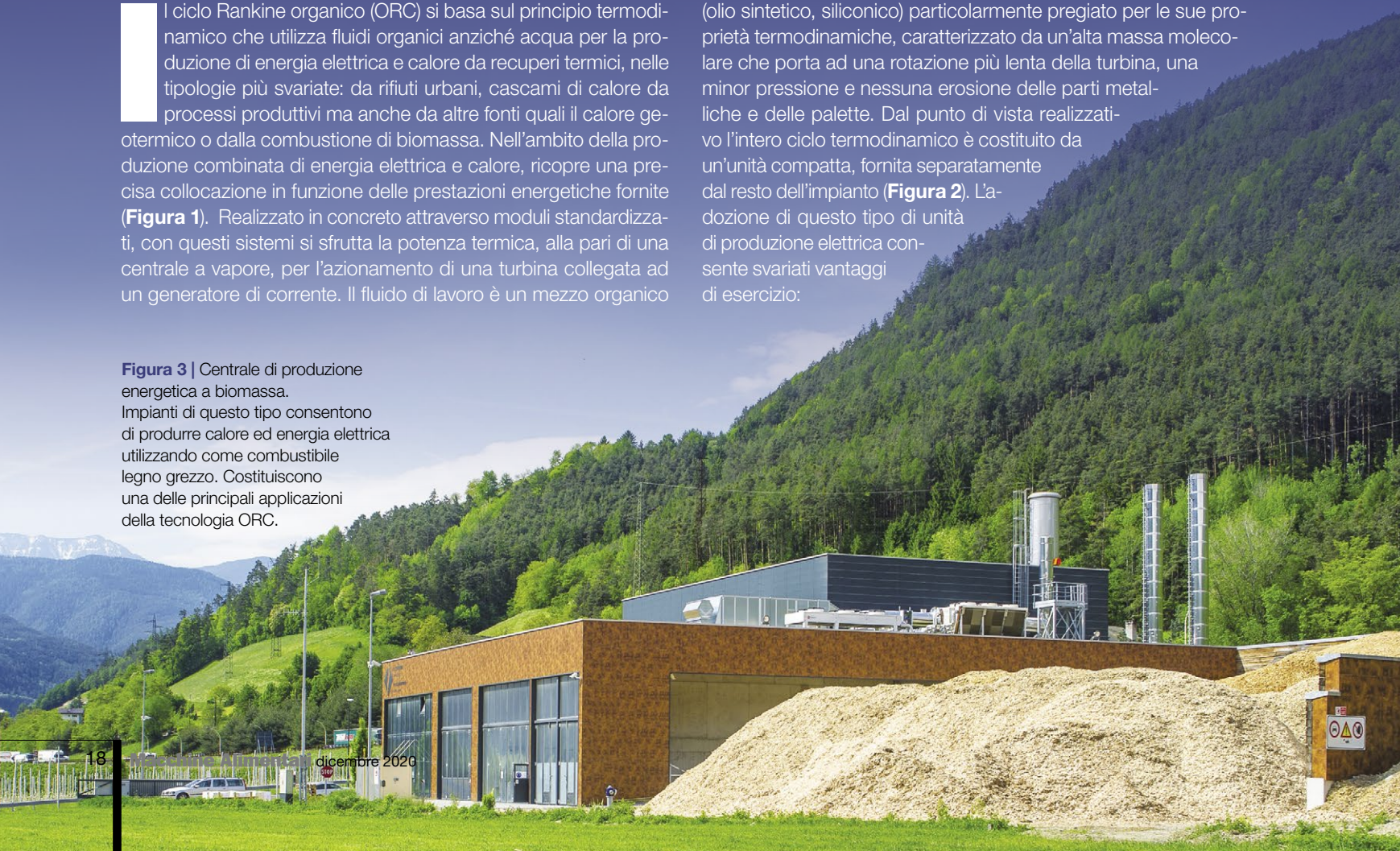
Figura 3 | Centrale di produzione energetica a biomassa. Impianti di questo tipo consentono di produrre calore ed energia elettrica utilizzando come combustibile legno grezzo. Costituiscono una delle principali applicazioni della tecnologia ORC.

(olio sintetico, siliconico) particolarmente pregiato per le sue proprietà termodinamiche, caratterizzato da un'alta massa molecolare che porta ad una rotazione più lenta della turbina, una minor pressione e nessuna erosione delle parti metalliche e delle palette. Dal punto di vista realizzativo l'intero ciclo termodinamico è costituito da un'unità compatta, fornita separatamente dal resto dell'impianto ( Figura 2 ). L'adozione di questo tipo di unità di produzione elettrica consente svariati vantaggi di esercizio: