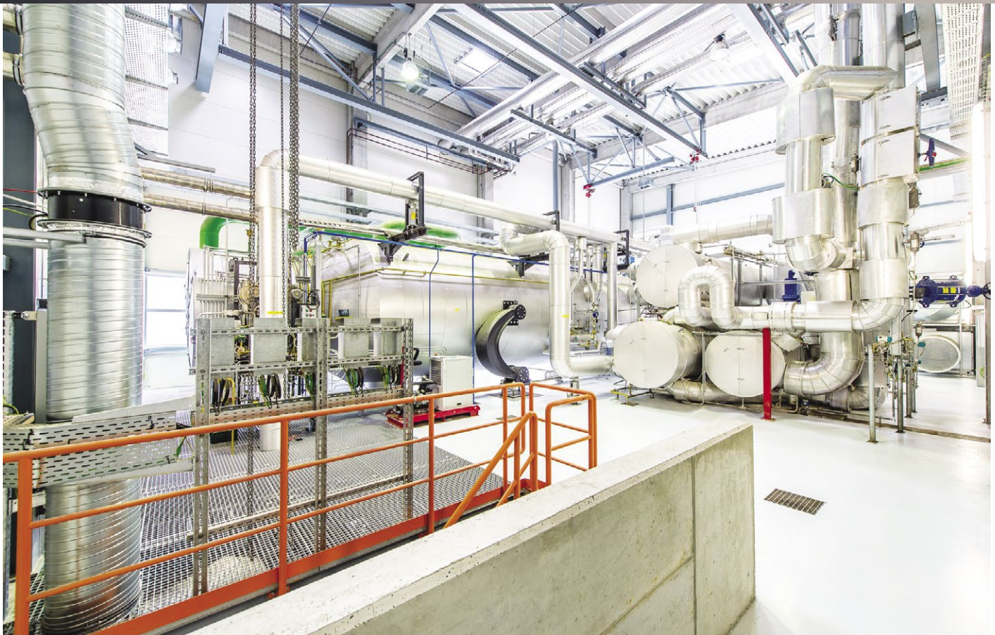
Figura 5 | L'impianto consta essenzialmente di quattro parti: impianto di produzione del calore o del recupero da altri impianti, impianto ad olio diatermico, modulo ORC e apparecchi per l'utilizzo dei cascami termici. (Turboden)